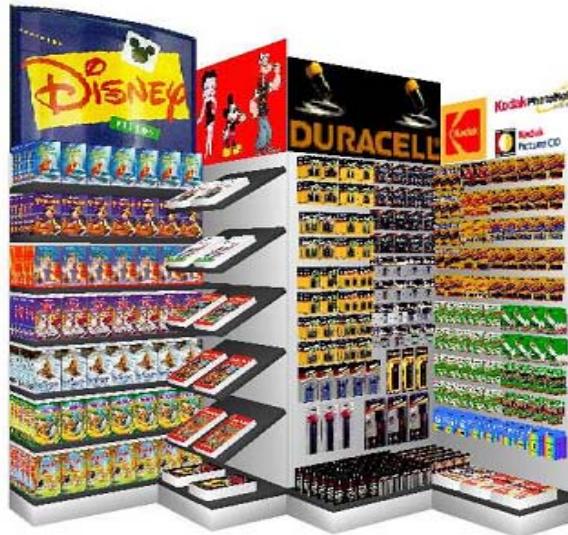
Wszechstronność - dowolna ekspozycja sklepowa