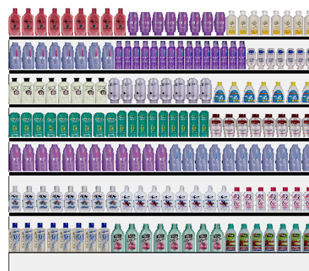
Artykuły chemiczne i kosmetyczne